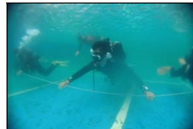
海上保安庁から講師を招いての潜水捜索訓練