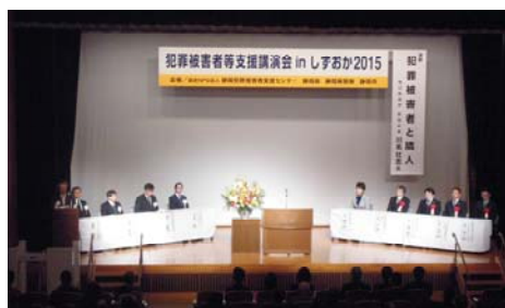
「犯罪被害者等支援講演会 in しずおか」の開催